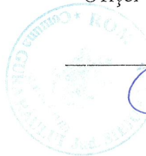
CONȚIU IOANA ofițer de stare civilă