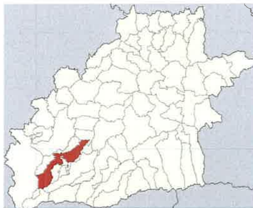
Localizarea Comunei Gura Raului pe harta Judetului Sibiu

Sediu: Com Teiu, sat Teiu, Jud Arges CUI : RO 30281706 J03/754/2012 Mail: office@greenbuildingstructure.ro